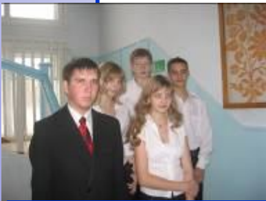
ОСУ «Единство» в ожидании министра