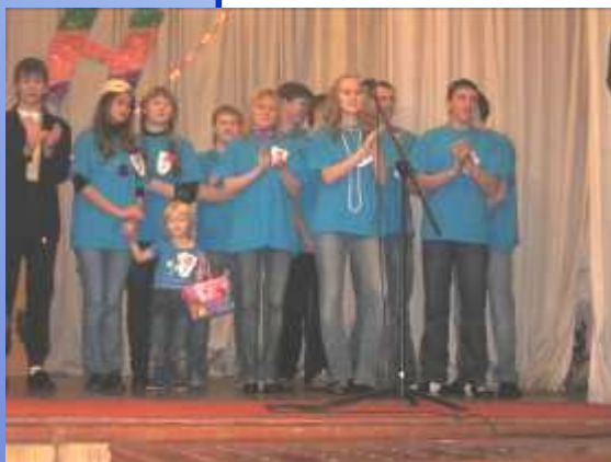
«РОК» - Рябинино