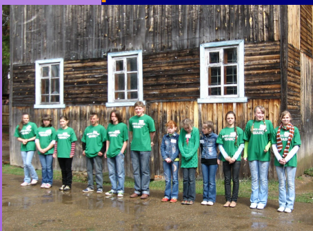
Гостеприимные хозяева слета курганские юнкоры «Перловки»

С 16 по 17 мая проходил долгожданный районный слет юных журналистов в селе Курган. С многих поселков и сел Чердынской земли приехали юнкоры, чтобы проявить себя и показать свои журналистские способности. Традиционно юнкорские слеты прини-