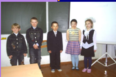
Участники конкурса из начальных классов

29.02. 08 прошел 1 конкурс ученических компьютерных презентаций «Я иду на урок!». В нем приняли участие учащиеся начальных, средних и старших классов .