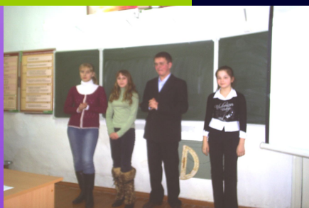
Участники конкурса из старших классов