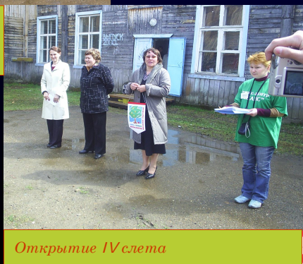
Открытие IV слета